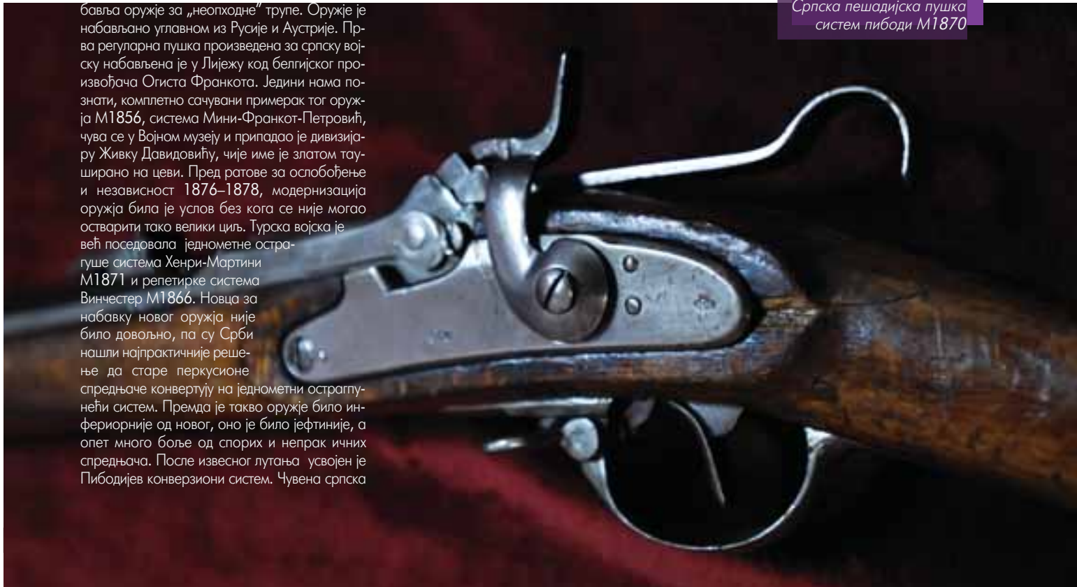
Српска пешадијска пушка систем пибоди М1870

Период 19. века је за Србију време ослободилачких ратова и борбе за независност и пут ка стварању модерне државе. Управо те чињенице условљавају њену потребу да модернизује своје оружје како би ишла у корак с временом и потенцијалним противницима.