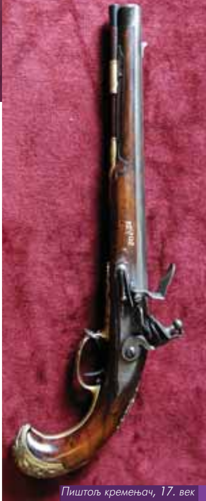
Пиштољ кременјач, 17. век

Ватрено оружје ове збирке чине оружје са системом ватре на коло и кремен и један примерак мускете фитиљаче која потиче из 17. века. Фитиљ је заправо најстарији и најпримитивнији систем ватре који је коришћен све до појаве механизма на коло и кремен. Оружје система на коло није никада добило ширу примену, јер је било компликовано за руковање и скупоцено, па га је углавном користила коњица. Основни делови механизма на коло су: табанска дашчица, ороз, точкић (коло), те отуда и назив колашица, затим опруга и систем полука са ланчићем. Челични точкић, назубљен по ободу, пролазио је кроз чанак, односно део у који се стављао барут за припалу. Специјалним кључем точкић се навијао за изврстан део круга и кочио у том положају. На његов обод спуштао се комад пирита, учвршћен у чељустима ороза. Повлачењем обараче, точкић се ослобађао и под дејством опруга брзо окретао. Трењем насталим између пирита и челичних зубаца точкића, стварале су се варнице које су палиле барут у чанку. Неспорно највреднији примерци ватреног оружја у нашој збирци