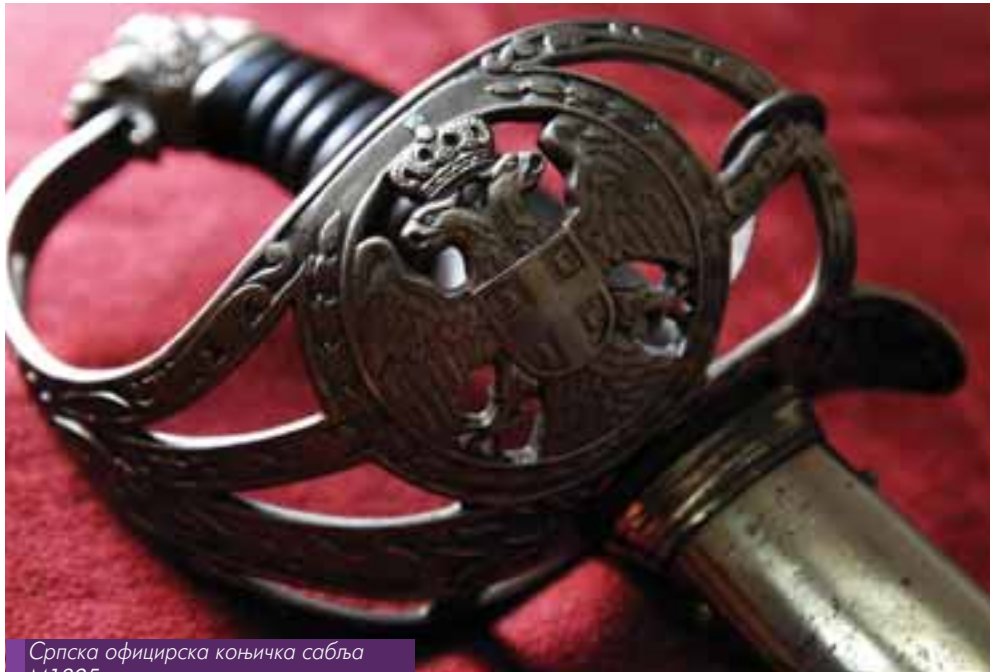
Српска официрска коњичка сабља М1895