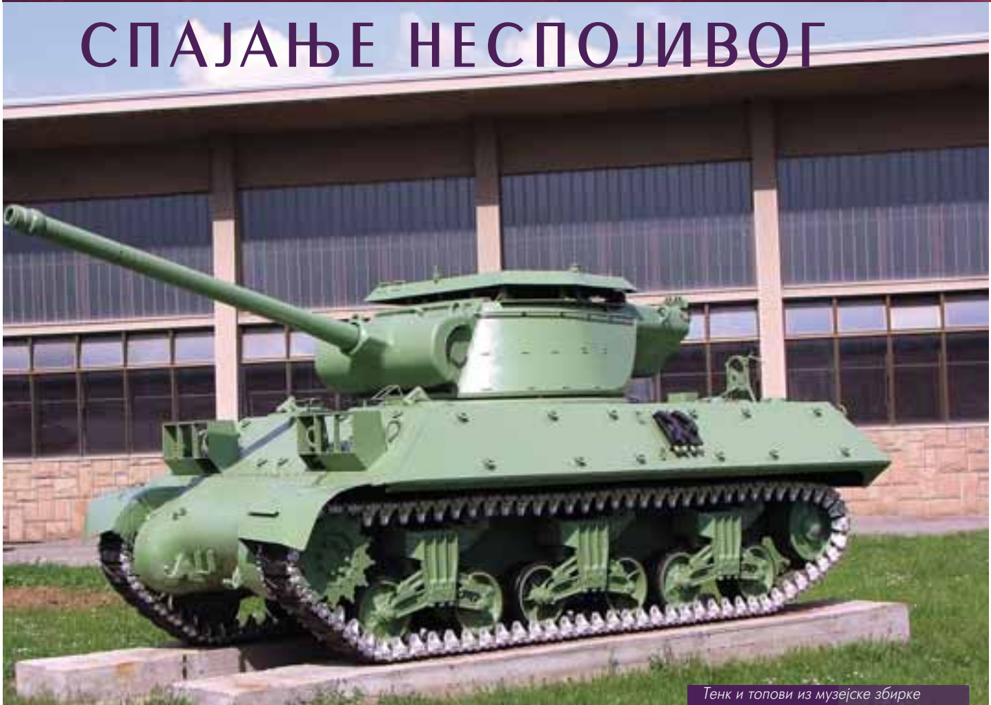
Тенк и топови из музејске збирке изложени на Војној академији

Значај ове збирке је велики, јер она у себи спаја експонате наоружања произведених на обе стране епохе хладног рата. И америчке и совјетске примерке, а поврх свега и експонате који сведоче о развоју домаће војне памети и индустрије. Зато ће она бити веома интересантна за све познаваоце наоружања, јер често спаја неспојиво. Са друге стране, прикупљена техника сведочиће о наоружању војске на овом простору у другој половини двадесетог века.