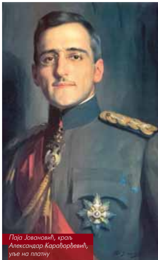
Паја Јовановић, краљ Александар Карађорђевић, уље на платну