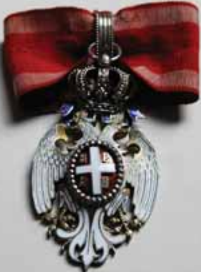
Орден Белог орла трећег степена генерала Михаила Срећковића