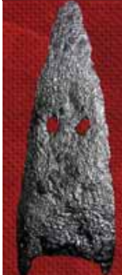
Од праисторије па до средњег века – секира, врхови копља, детаљ мача и накит

данас, представља битан део духовне и материјалне културе људских заједница. Поред прстења, које је било један од најпопуларнијих типова накита у овом периоду, значајно је поменути и бронзани привезак облика равнокраког троугла, украшеног геометријским орнаментом, и неколико фибула, које су у почетку првенствено имале функционалну примену, а потом постају и декоративни елемент на видљивим деловима одеће који често представља и обележје друштвеног статуса. Важно је поменути и изузетан коштани украсни предмет, кружног облика, са нарежаним крајевима, чија је површина украшена орнаментом у виду вишелатичног цвета, и два фрагментована, дворедна коштана чешља украшена геометријским орнаментом.