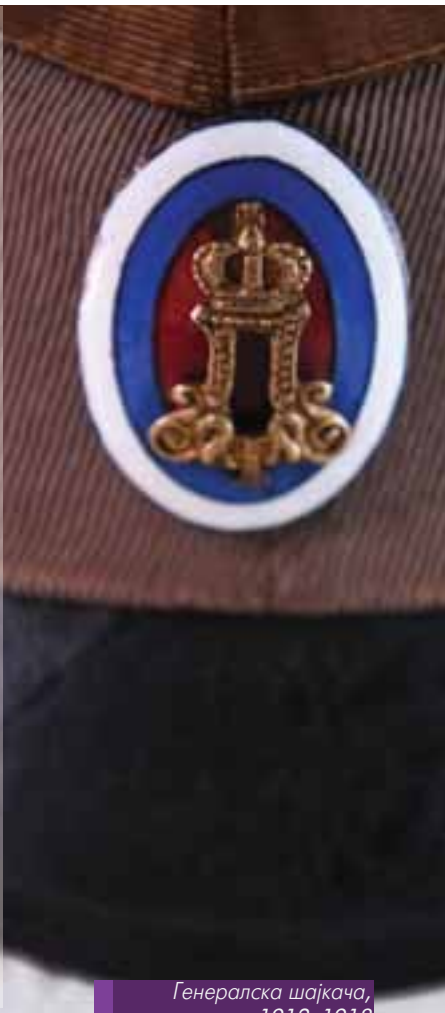
Генералска шајкача, 1912–1918