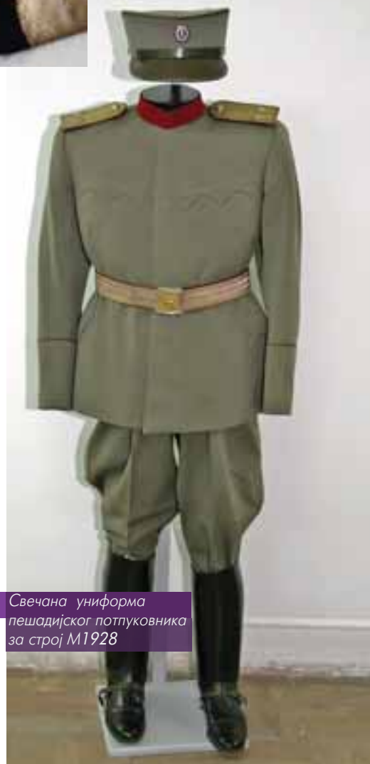
Свечана униформа пешадијског потпуковника за строј М1928