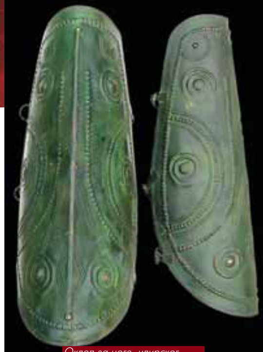
Оклоп за ноге илирског ратника

Најстарија артефакта којима располаже Археолошка збирка потичу из млађег каменог доба, неолита. Тај период репрезентује већи број керамичких пршљенака, коштаних шила, неколико камених длета и камених секира. Нарочито су интересни камени предмети купастог облика обрађени техником глачања, чији су дистални крајеви обликовани у шиљак, док се проксимални претвара у дужу дршку, а који потичу са налазишта Винча крај Београда.