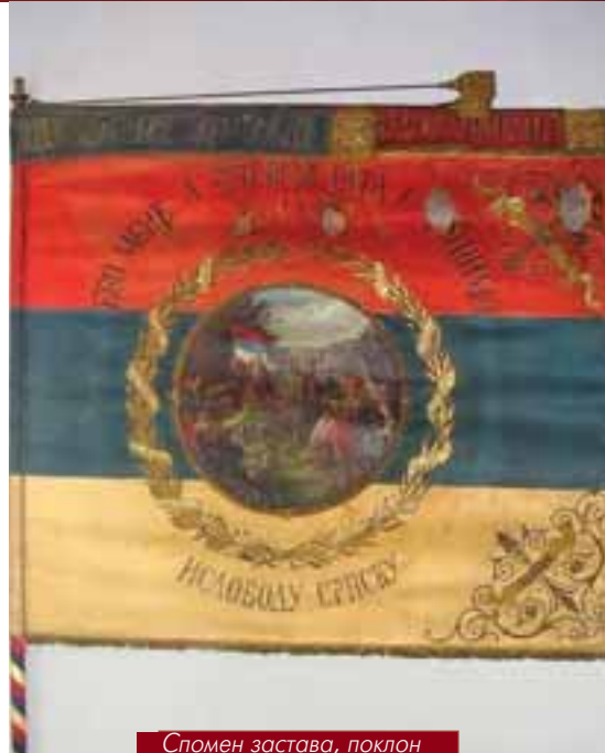
Спомен застава, поклон Рудничана кнезу Милану Обреновићу поводом пунолетства 1872

У српској историји симболи на заставима мењали су се у зависности од статуса саме државе, њеног државног уређења, од верских и културних утицаја земаља са којима је била у одређеном односу. Највећи утицај у употреби симбола на знамењима средњовековне српске државе имала је Византија. Верује се да су Византинци употребљавали заставе с крстовима већ у 14. веку. Царска заставка је била са златним крстом који је међу крацима имао четири слова В (што је значило василевс). Пошто западна хералдика није знала за слова у грбу, она су протумачена као хералдичке фигуре. Та слова су одговарала општили (оцилу), предмету потребном сваком војнику. То је био згодан симбол за ратну заставу, нарочито од почетка 14. века кад је почела употреба ватреног оружја. Овај симбол преузет од Византије, и данас је, поред двоглавог орла, један од елемената у српском грбу. О симболима на средњовековним српским заставима сазнајемо и са новца и печата тог времена. Употреба симбола двоглавог орла позната је још пре Душановог царства. Јак утицај Византије видљив је и