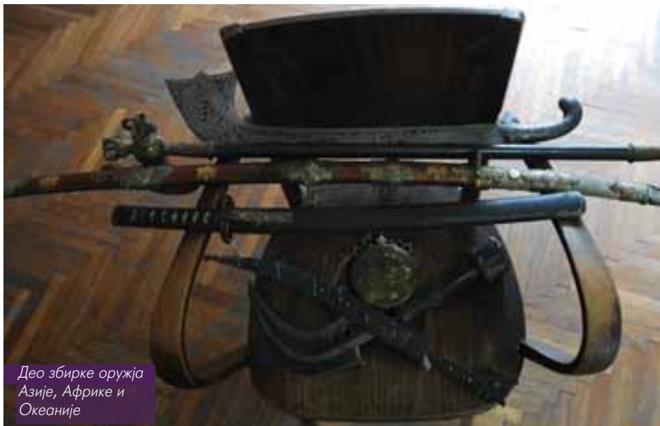
Део збирке оружја Азије, Африке и Океаније

ња дрвета и камена, јер метал у Океанији до појаве Европљана није био познат. Најзначајније је оружје са Адмиралских острва. Становници овог подручја користили су копља, ређе бодже, секире, а лук и стрелу су употребљавали само за лов. Од 1887. почели су да, посредством Европљана, користе ручно ватрено оружје. Карактеристика њиховог оружја је што су врхови копља и бодже од обсидијана – камена вулканског порекла.