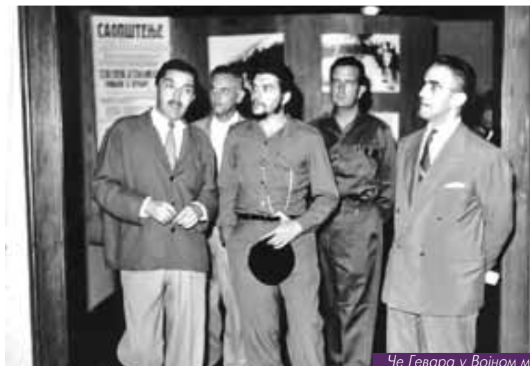
Че Гевара у Војном музеју

Смештен у недрима Београдске тврђаве, за многе најлепшем делу Београда, Војни