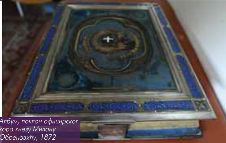
Албум, поклон официјерског кора кнезу Милану Обреновићу, 1872

су једног дана месеца јануара ове године освајали мртви у заробљеничком логору у Ашаху у Аустрији, услед зиме и глади. Ову је слику пренео један од наших размењених војника, који је био у заробљеничком логору. Молим да се по једна фотографија пошаље сваком батаљону и нареди да се иста покаже сваком војнику и том приликом на убедљив начин му представе тешке муке, невоље и патње, које немилосрдно сатиру наше војнике у ропству код непријатеља”.