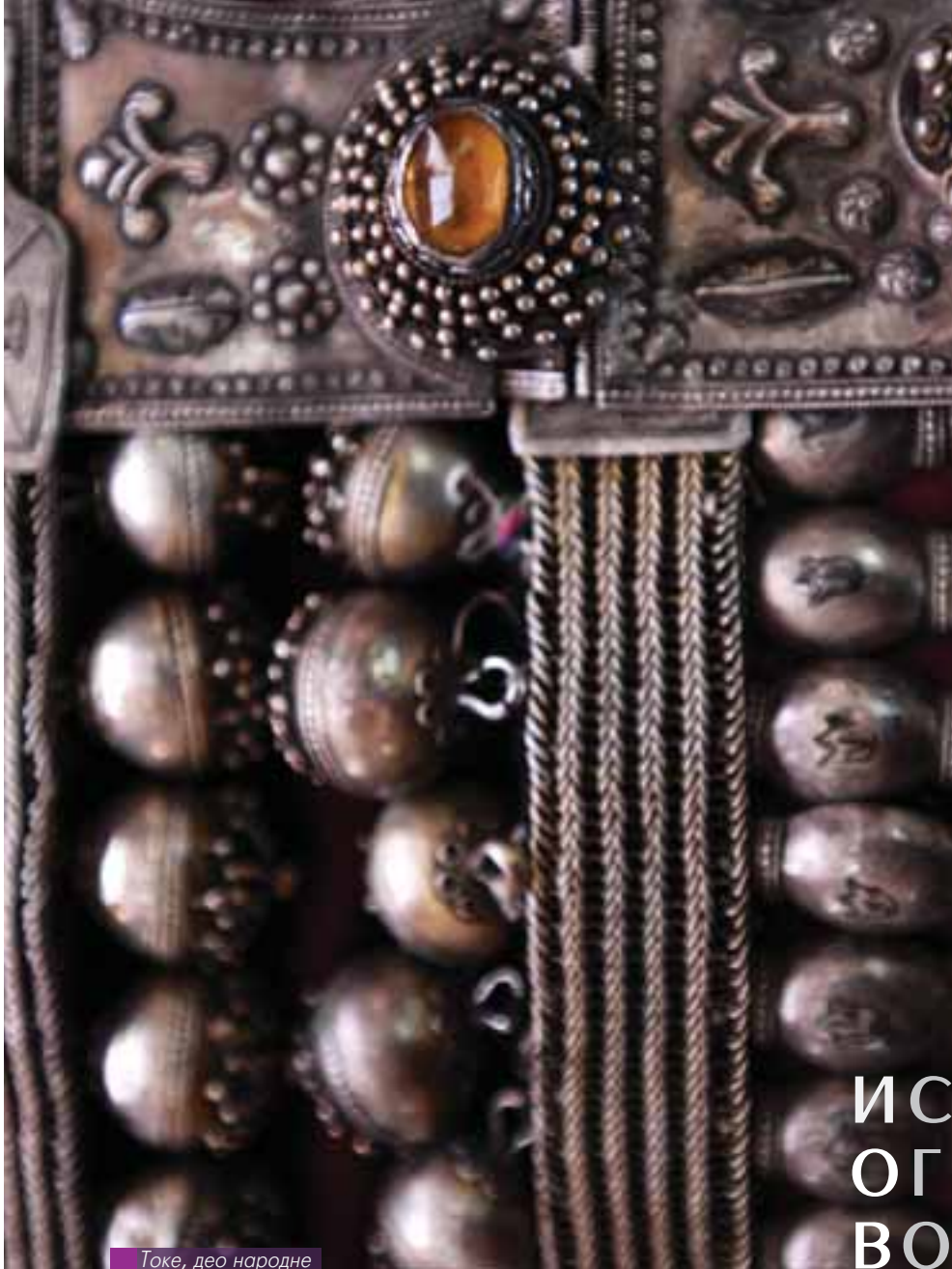
Токе, део народне ношње, детаљ