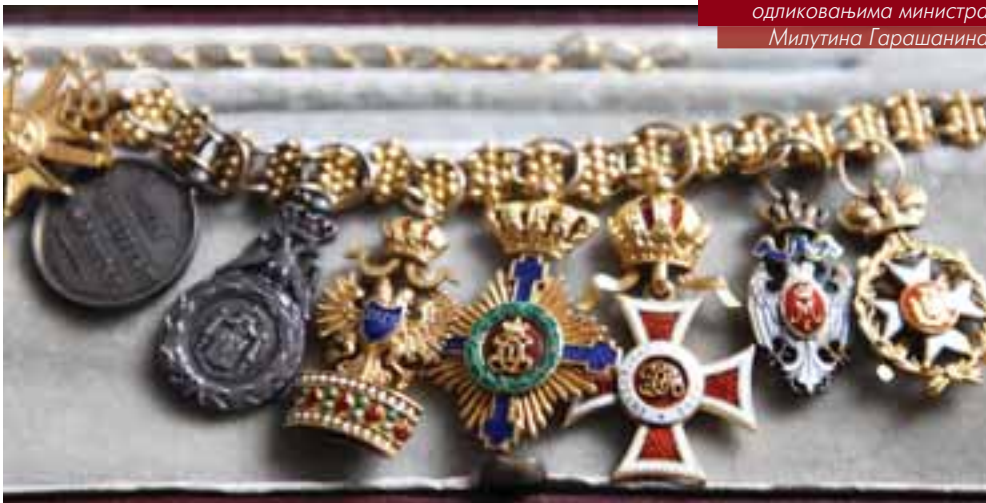
Ланчић са минијатурним одликовањима министра Милутина Гарашанина

Збирка поседује варијанте ових медаља које украшавају многе гране (дашчице) са одликовањима високих официра. Сада су овде захваљујући потомцима који су учинили велики дар Војном музеју.