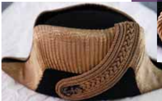
Део парадне адмиралске униформе краља Александра Карађорђевића