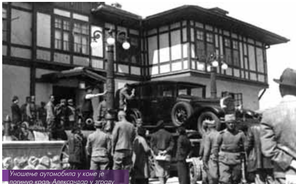
Уношење аутомобила у коме је погинуо краљ Александар у зграду Војног музеја, 1937

руске регалије и многе друге драгоцености. Поред Војног музеја, опљачкани су и страдали Градски, Железнички, Технички, Црквени, Природњачки музеј, те Музеј српске земље и Шумско-ловачки музеј, али и други мањи музеји. У