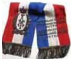
Лента заставе четрнаестог лешадијског пука Престолонаследника Петра