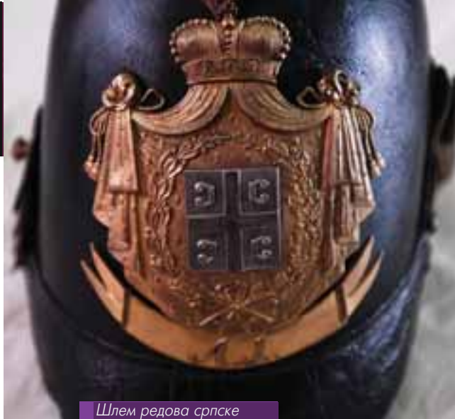
Шлем редова српске војске М1847

Важан део збирке представљају архивалије. Овде подразумевамо својеврсне документарне изворе, који у највећој мери покривају период од 1941. до 1945. године, а мањи број се односи на време после 1946. или на