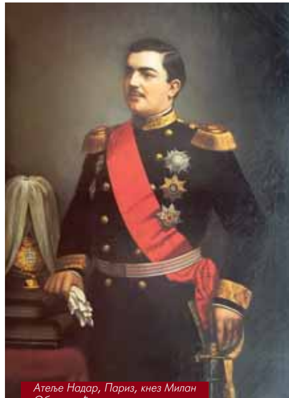
Атеље Надар, Париз, кнез Милан Обреновић, уље на платну

Данас Уметничка збирка Војног музеја поседује око три хиљаде радова и они су различити и по времену настанка и по својој ликовној вредности. У дугом раздобљу од XVII века, које потресају ратови и бурни историјски догађаји, стварало је више сликарских нараштаја различитих опредељења. Заступљена су дела водећих представника барока, романтизма, реализма, сецесије, импресионизма, поетског и колористичког