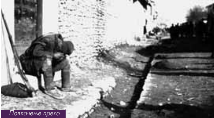
Повлачење преко Албаније, 1915

Нажалост, период мира није дуго трајао. Нови светски рат погодио је и нашу земљу. Ратна збивања, патње, страдања, страх и бол опет су се нашли пред објективима бројних аматера и професионалних фотографа. Свесни огромне моћи фотографије све стране у