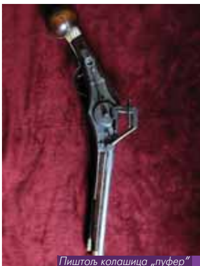
Пиштољ колашица „луфер“ друга половина 16. века