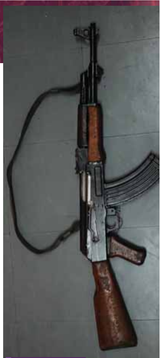
Аутоматска пушка АК-47

Последња ратна дешавања на територији Србије су такође добила своје место у Војном музеју и допунила фонд ове збирке. Један део повезан је са борбом против албанских сепаратиста и, као у случају сукоба у Хрватској, овде постоји широк арсенал оружја са свих страна света. Од заплењеног оружја збирка поседује аутоматске пушке М-56 кинеске и М-68 корејске производње, затим ки-