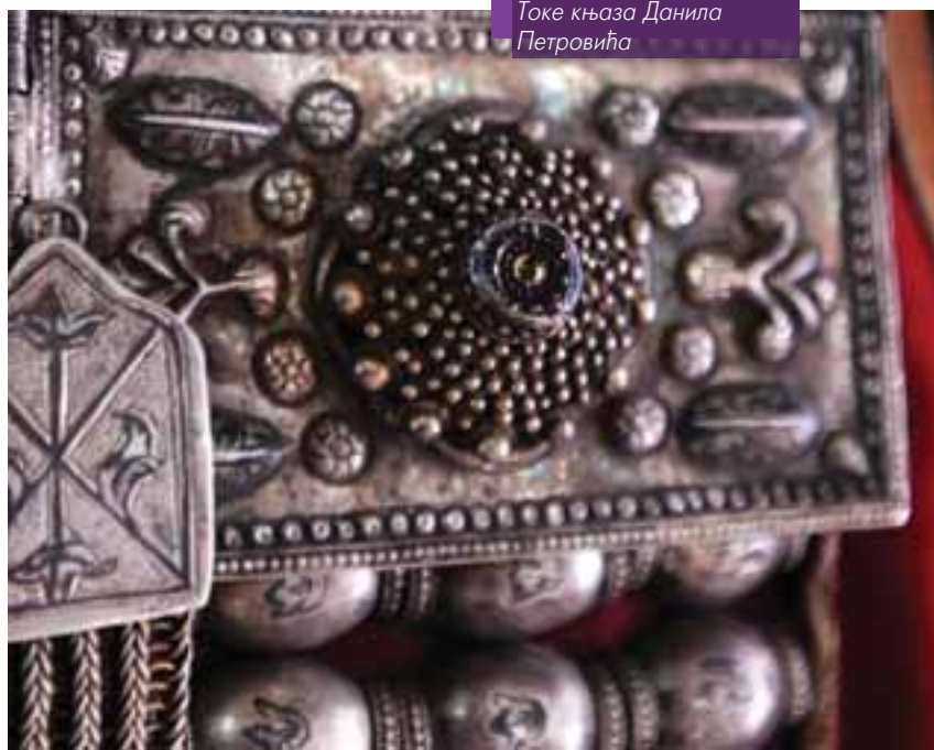
Токе књаза Данила Петровића