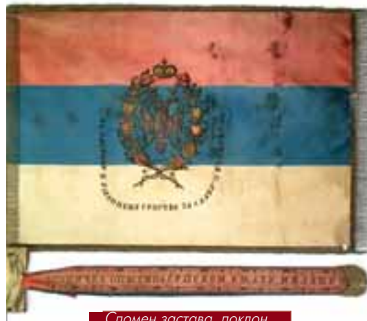
Спомен застава, поклон Лозничана кнезу Милану Обреновићу поводом пунолетства 1872